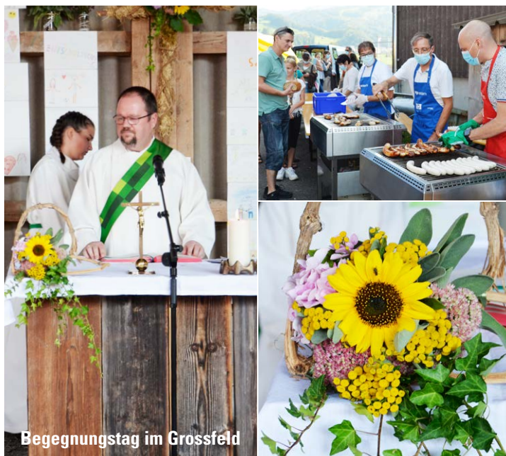
Begegnungstag im Grossfeld