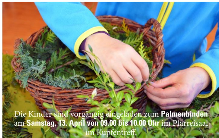
Die Kinder sind vorgängig eingeladen zum Palmenbinden am Samstag, 13. April von 09.00 bis 10.00 Uhr im Pfarreisaal im Kupfertreff.

Am Palmsonntag feiern wir den festlichen Einzug Jesu in Jeru- salem. Wir tun das im Familiengottesdienst am 14. April um 10.30 Uhr . Besonders eingeladen sind die Kinder der dritten Klasse, die ihren 5. Weggottesdienst unterwegs zur Erstkommunion feiern.